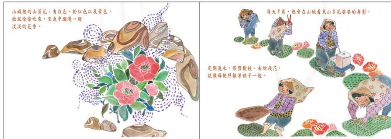
※範例作品：教育部反毒繪本—山茶花婆婆/洪孟真、呂舒婷