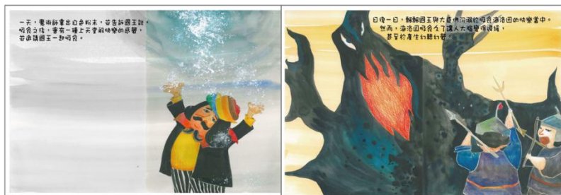
※範例作品：教育部反毒繪本—飄飄王國滅亡記/洪孟真、呂舒婷