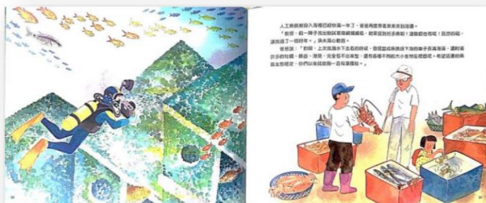
圖 3 橫式紙張創作示意圖（1 組 = 兩頁）