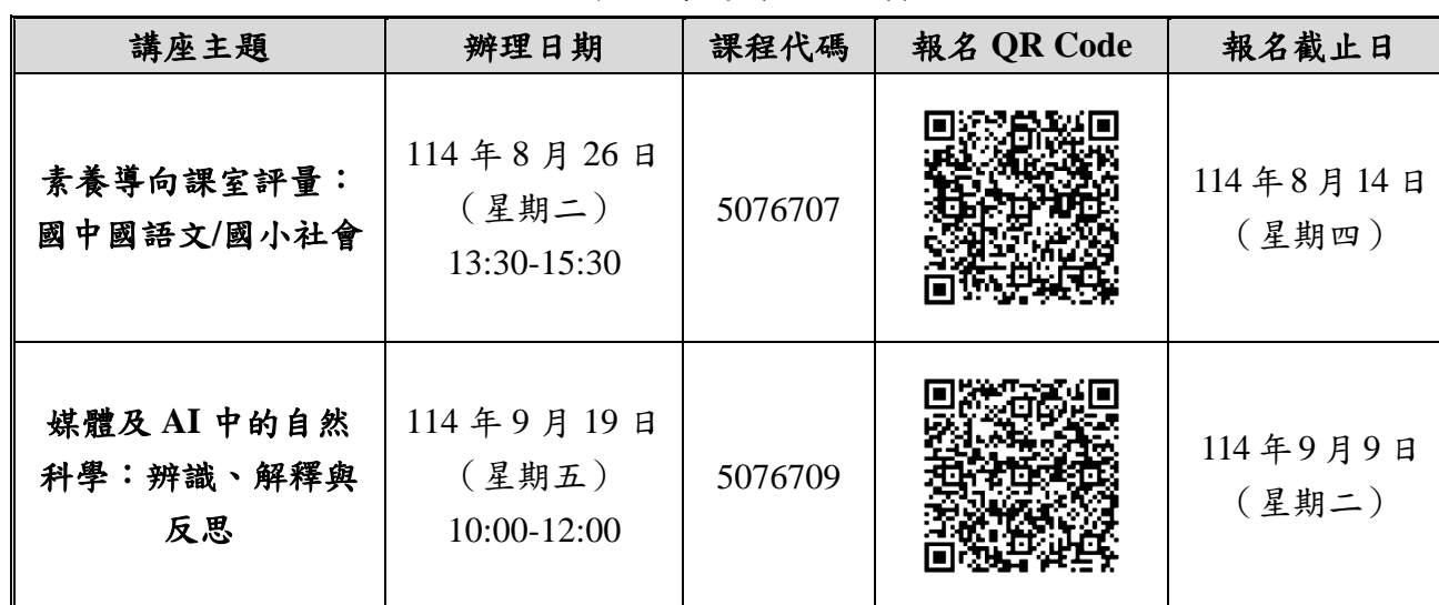
表 2 專題講座報名資訊